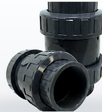
TABLA DE DIMENSIONES