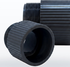
TABLA DE DIMENSIONES